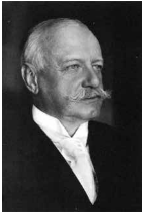
Reichskanzler Bernhard von Bülow (1849 - 1929)

zuzustimmen, von der Überzeugung der Sinnhaftigkeit des Krieges ab. Sehr unterschiedlich aber war das Verfahren, durch das es zur Parlamentsauflösung kam. 1906 hatte Reichskanzler Bernhard von Bülow zwar in einer konkreten Frage keine Mehrheit im Reichstag mehr, aber er musste deshalb nicht wie Bundeskanzler Olaf Scholz die Vertrauensfrage stellen und auch nicht zurücktreten. Der Grund dafür war, dass er gar nicht vom Reichstag gewählt, sondern vom Kaiser, dem Staatsoberhaupt, ernannt war. Deshalb war er auch nur vom Vertrauen des Kaisers abhängig und konnte auch nur von ihm entlassen werden. In gewisser Weise war er natürlich trotzdem auf den Reichstag, der gemeinsam mit dem Bundesrat das Etat- und Gesetzgebungsrecht hatte, angewiesen. Aber wenn das Parlament seinen Maßnahmen und Gesetzesvorschlägen nicht zustimmte, konnte er es jederzeit im Einverständnis mit dem Kaiser auflösen und sich durch Neuwahlen neue Mehrheiten suchen.