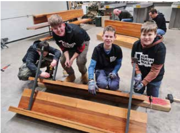
Die Arbeit in der Werkstatt macht sichtlich Spaß.

Derweil ist die erste Hälfte der verkleinerten Bänke schon wieder in der evangelischen Kirche angekommen. Der Kirchraum wirkt jetzt noch luftiger und heller. Die neuen Bänke lassen viele Stellmöglichkeiten zu. Die Schülerin und Schüler der Gesamtschule sind sich einig: