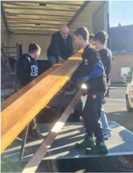
Beim Verladen ist Teamwork gefragt.