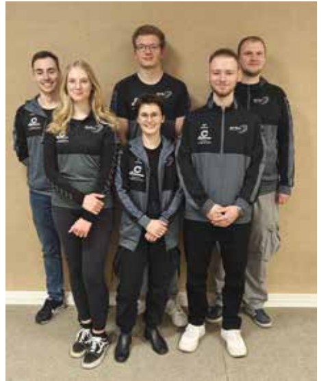
3. Mannschaft Verbandsliga