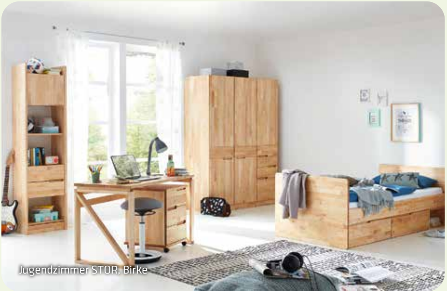
Jugendzimmer STOR, Birke