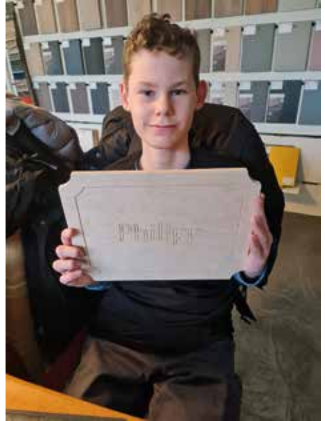
Gesägt, geschmirgelt und mit dem Namen versehen, ein persönliches Werkstück.

Mit Begeisterung wurde geschraubt und die Holzteile für das Sägen sortiert und bereitgestellt. Die technische Ausstattung der Werkstatt beeindruckte die Gäste sichtlich. Ein persönliches Werkstück durften die Jugendlichen auch bearbeiten und mit nach Hause nehmen: Ein mit dem Namen verziertes großes Frühstücksbrett.