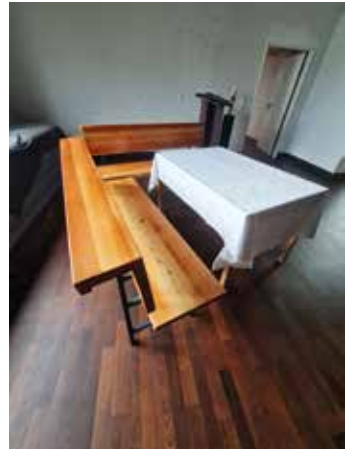
Die ersten neuen Bänke sind schon wieder im Einsatz und schaffen ganz neue Möglichkeiten.