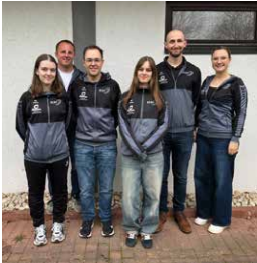
2. Mannschaft 2. Bundesliga

Somit wird unser Nachwuchs mit neuer Hoffnung und Stärke in der kommenden Saison in der Bezirksliga antreten.