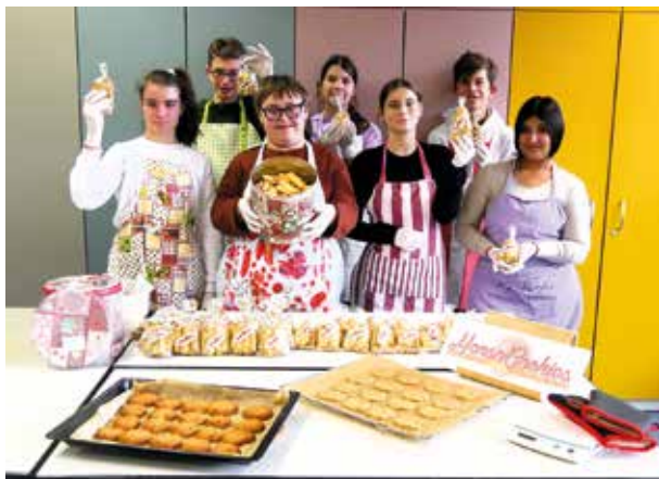
Die Mensa-Cookies backen für den Weihnachtsmarkt in Le Mans

Am Dienstag, dem 10.12.24, erwartete alle Schüler:innen des 6. Jahrgangs an der Gesamtschule Paderborn-Elsen ein besonde-