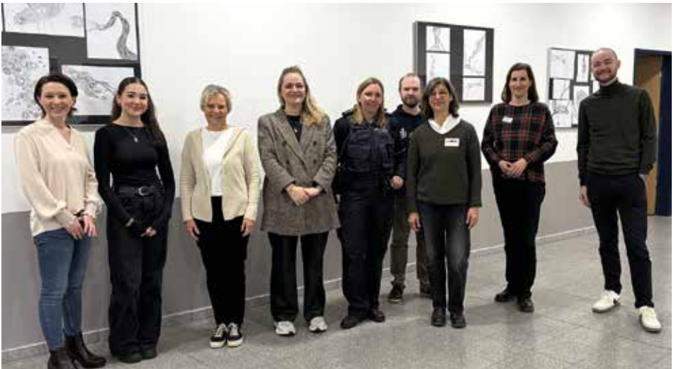
Berufsorientierungs-Tag in der Oberstufe