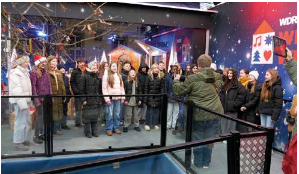
Die Gesamtschule beim WDR-Weihnachtswunder