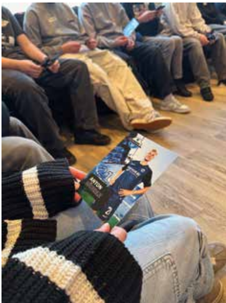
„Diskriminierung die rote Karte zeigen“ – Workshop der 9a mit dem SCP